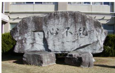
半田東高校 校訓碑