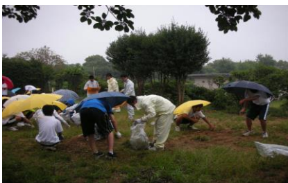
<ボランティア清掃>