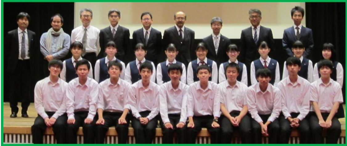
閉会式終了後 日本福祉大学の先生方と記念撮影